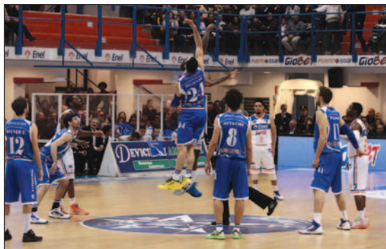
Enel Basket Brindisi-Banco di Sardegna Sassari